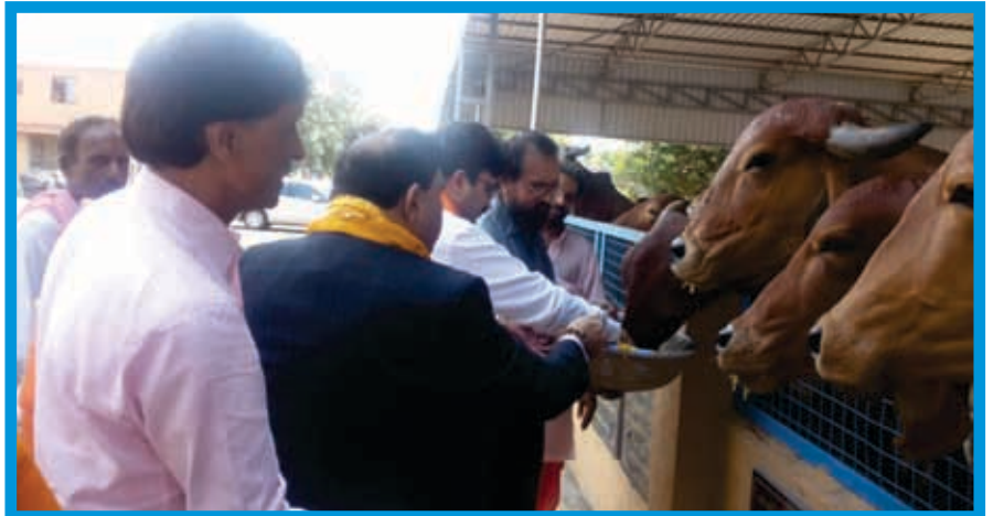
સંકલન : મિતલ ખેતાણી (સંયુક્ત મંત્રી)

ગૌ માતાને ભારતીય સંસ્કૃતિની સંવર્ધક માનવામાં આવે છે. ગાય માતાની પૂજા સેવાથી અનેક પ્રકારનાં મનોરથો સિદ્ધ થતા હોવાનું શાસ્ત્રોમાં કહેવાયું છે અને અનુભવાયું છે. આપણા વિસ્તારમાં જ્યાં પણ નજીકમાં ગૌશાળા હોય ત્યાં કોઈ ને કોઈ પ્રકારે યથાશક્તિ ગૌસેવા થાય તો તે પરિવાર માટે કલ્યાણકારી બની રહેશે તેમાં શંકાને કોઈ સ્થાન નથી.